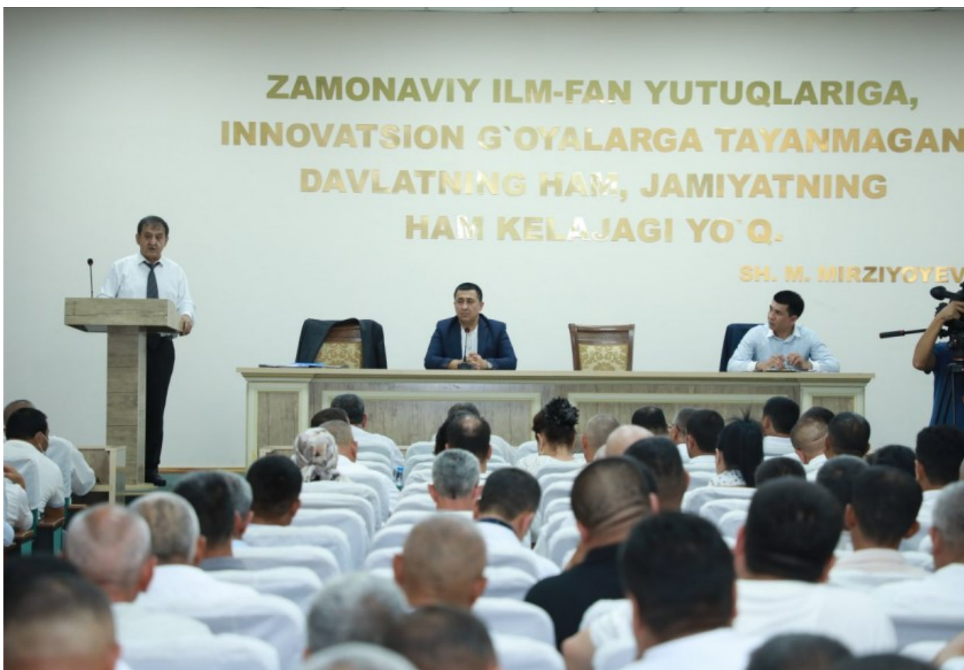
Mahalla raislari o'quviga start berildi

Joriy yilning 1 iyuldan boshlab Respublika bo'ylab mahalla raislarini malakasini oshirish belgilangan.