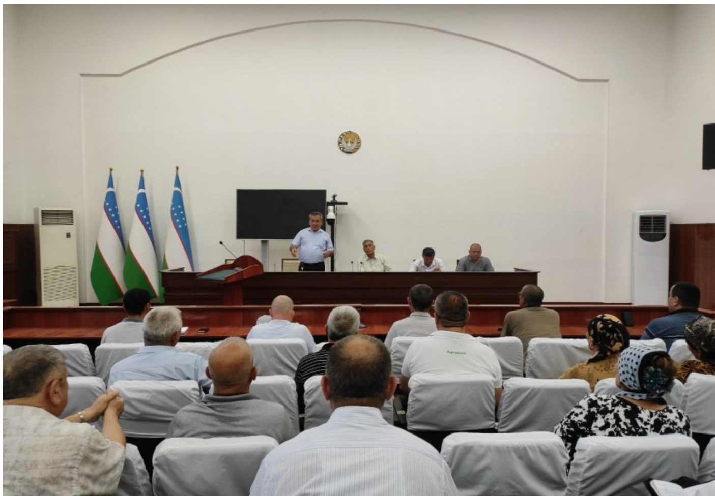
Mening konstitutsiyam - tinch, to'kin hayotim kafolati